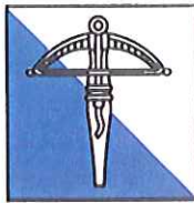
GESELLSCHAFT DER BOGENSCHÜTZEN IN ZÜRICH