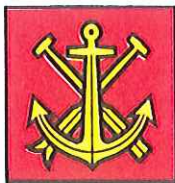
ZUNFT ZUR SCHIFFLEUTEN