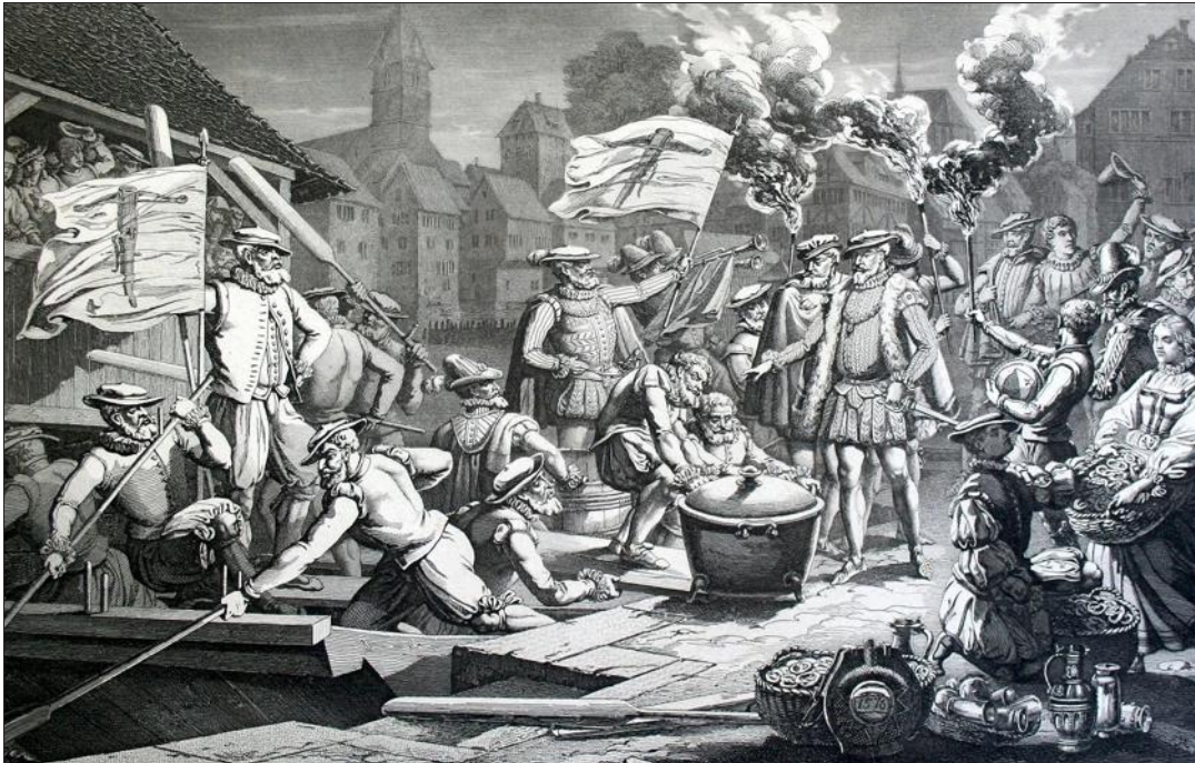
C'était en 1576, juste avant le départ à Zurich : le chargement de la bouillie de millet.

En 1946, après la guerre, le Limmat Club de Zurich renoua avec la tradition de la Hirsebreifahrt. Depuis cet-