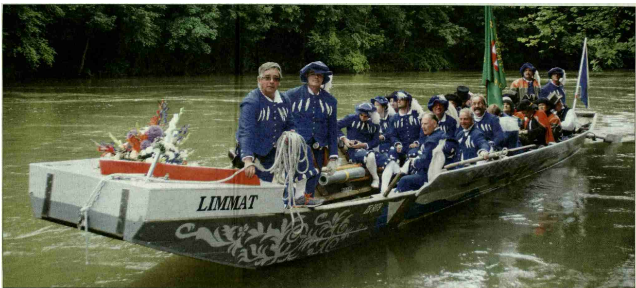
Ankunft am Limmat-Landesteg oberhalb des Kraftwerkes Aue, Baden

Vorzügen und Aktivitäten, welche Baden zu bieten habe, im Bilanz-Ranking vor Baden liege, wurde mit tosendem Beifall quittiert. Mit städtischen Landwirtschaftsprodukten und einer Hirsebreifahrtkanne 2016 bedankte sie sich für das Gastrecht. Später trafen sich Hirsebreifahrer, Zünfte und Stadträte im Bäderquartier zu Speis und Trank. Dabei wurden alte Freundschaften gepflegt und neue geschlossen. Leider mussten die Hirsebreifahrer dabei zur Kenntnis nehmen, dass der hohe Wasserstand der Limmat eine Weiterfahrt verunmöglichte. So wurden die Schiffe auf dem Landweg verschoben, um sie kurz vor Rheinfeldern, dem Etappenort, wieder zu wassern. ●