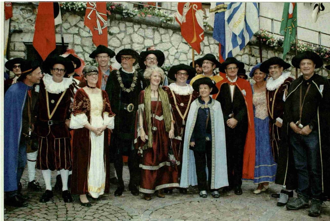
Vereint – die Regierung beider Städte