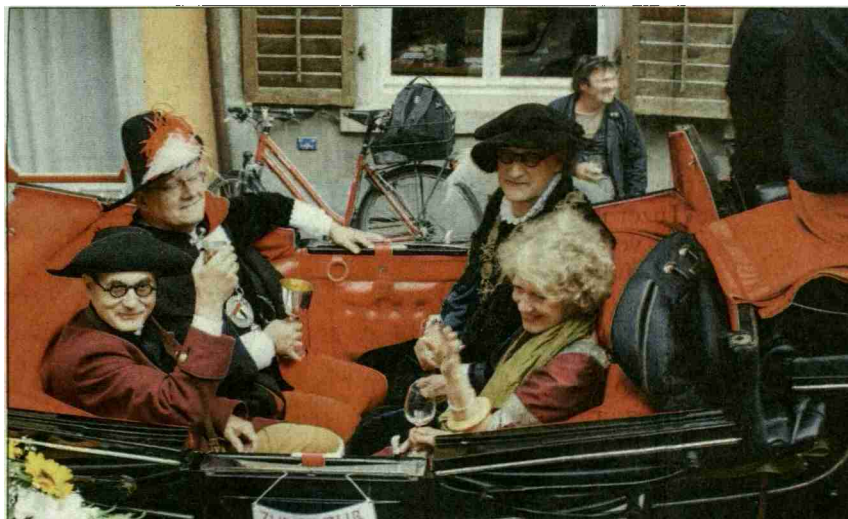
Prominenz auf der Kutschenfahrt zum Cordulaplatz

«Züri Fäscht» zollte sie der alle zehn Jahre stattfindenden «Badenfahrt» grossen Respekt. Die Aussage, dass sie es nicht verstehen könne, dass Aarau, trotz den vielen Vorzügen und Aktivitäten, welche Baden zu bieten habe, im Bilanz-Ranking vor Baden liege, wurde mit tosendem Beifall quittiert. Mit städtischen Landwirtschaftsprodukten und einer Hirsebreifahrtkanne 2016 bedankte sie sich für das Gastrecht. Später trafen sich Hirsebreifahrer, Zünfte und Stadträte im Bäderquartier zu Speis und Trank. Dabei wurden alte Freundschaften gepflegt und neue geschlossen. Leider mussten die Hirsebreifahrer dabei zur Kenntnis nehmen, dass der hohe Wasserstand der Limmat eine Weiterfahrt verunmöglichte. So wurden die Schiffe auf dem Landweg verschoben, um sie kurz vor Rheinfelden, dem Etappenort, wieder zu wassern.