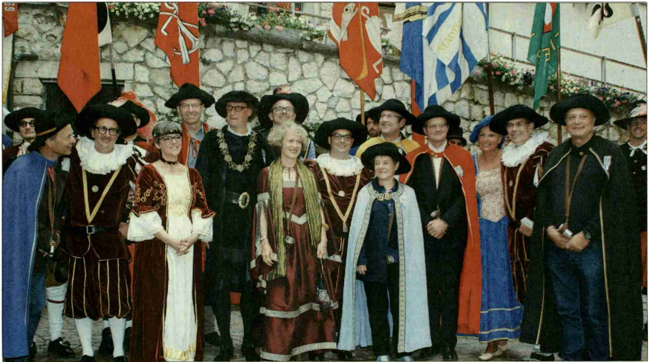
Vereint – die Regierung beider Städte

Themen-Nr.: 034.006 Abo-Nr.: 3003399 Seite: 11 Fläche: 125'260 mm 2