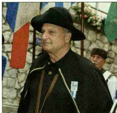
Zürcher Stadtrat Filippo Leutenegger