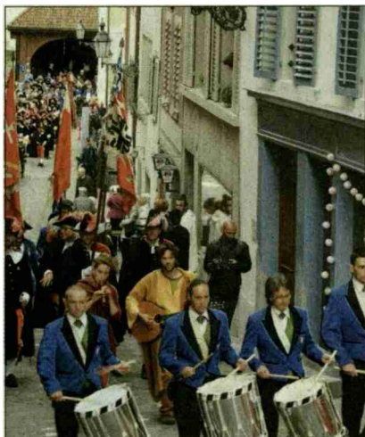
Der Einzug von der Aue über die Holzbrücke durch die Halde