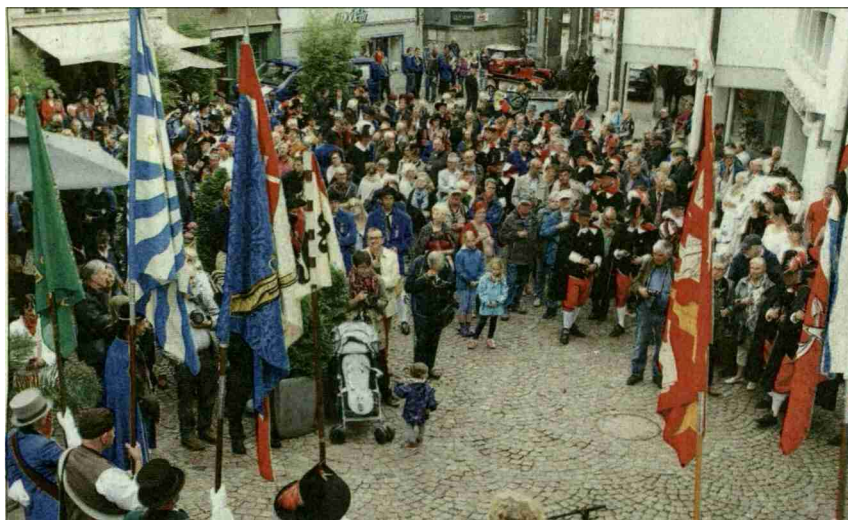
Viel Volk genoss Wein und Spanischbrödli auf dem Cordulaplatz