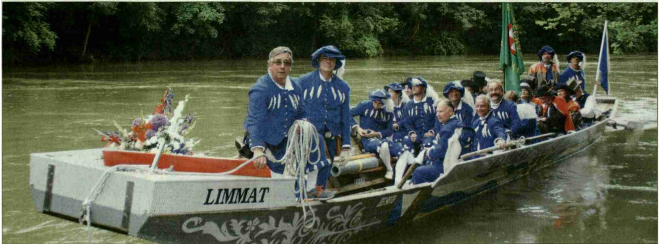
Ankunft am Limmat-Landesteg oberhalb des Kraftwerkes Aue, Baden