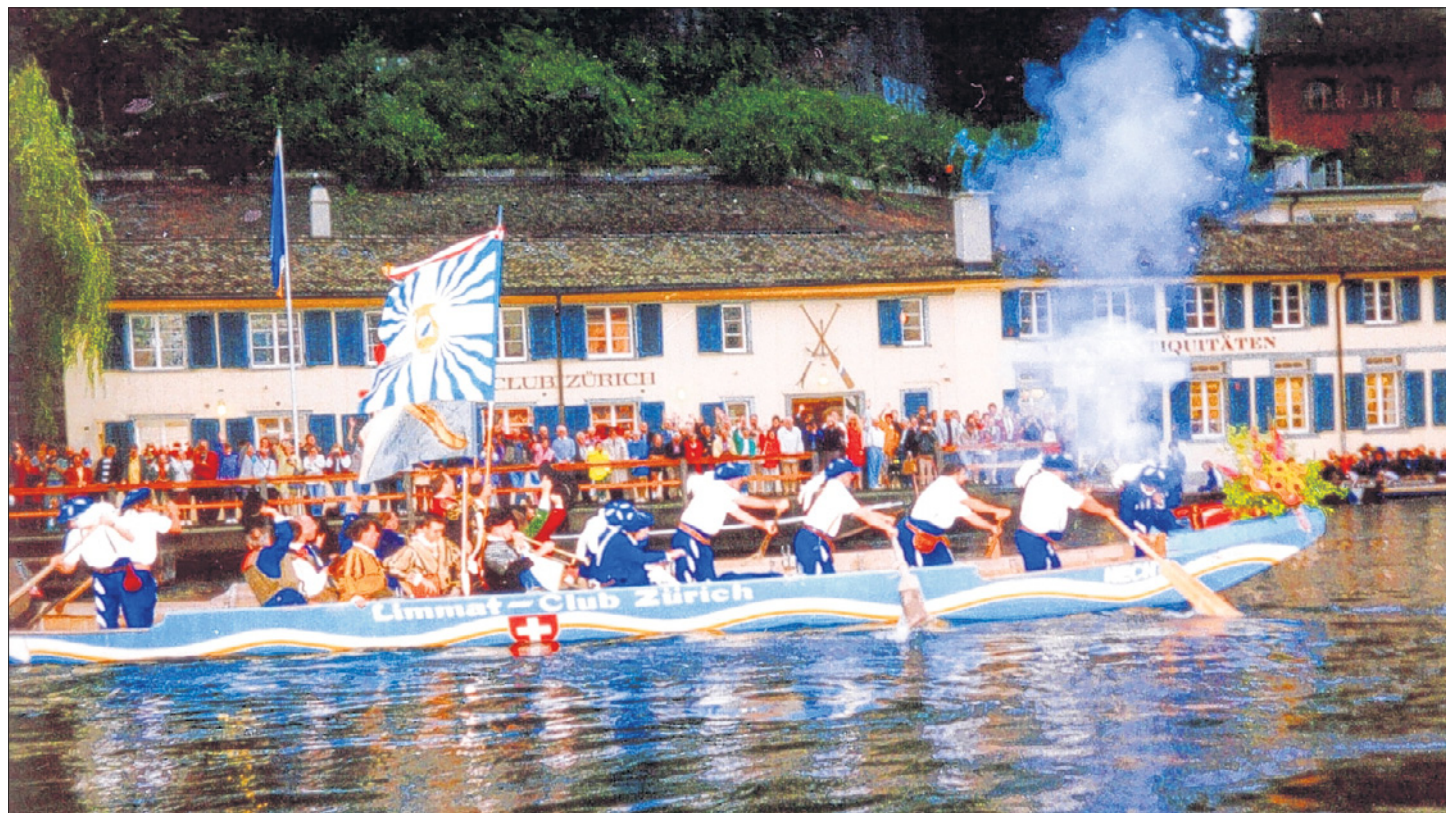
IM GLEICHTAKT Nach zehn Jahren findet vom 24. bis zum 27. August wieder eine Hirsebreifahrt von Zürich nach Strassburg statt.