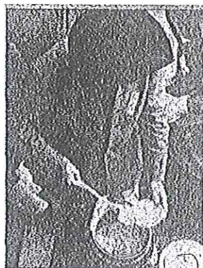
HEISSER BREI War früher nur ein Tag unterwegs.

Beim ersten Mal soll der Hirsebrei, den man mit Lappen und Stroh eingepackt hatte, bei der Ankunft in Strassburg tatsächlich noch heiss gewesen sein. Die Fahrt dauerte einen einzigen Tag. Jetzt, wo man drei Tage unterwegs ist, will man der nahrhaften Speise die Reise nicht zumuten. Effektiv wird es so sein, dass es zwar noch Hirsebrei gibt für alle diejenigen, welche bei der Abfahrt in Zürich dabei sein wollen, dann aber werden neu zubereitete 500 Portionen auf der Strasse und nicht auf dem Schiffweg nach Strassburg transportiert, wo sie unter die Leute gebracht werden. Ein wenig