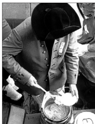
HEISSER BREI War früher nur ein Tag unterwegs.

Beim ersten Mal soll der Hirsebrei, den man mit Lappen und Stroh eingepackt hatte, bei der Ankunft in Strassburg tatsächlich noch heiss gewesen sein. Die Fahrt dauerte einen einzigen Tag. Jetzt, wo man drei Tage unterwegs ist, will man der nahrhaften Speise die Reise nicht zumuten. Effektiv wird es so sein, dass es zwar noch Hirsebrei gibt für alle diejenigen, welche bei der Abfahrt in Zürich dabei sein wollen, dann aber werden neu zubereitete 500 Portionen auf der Strasse und nicht auf dem Schiffweg nach Strassburg transportiert, wo sie unter die Leute gebracht werden. Ein wenig