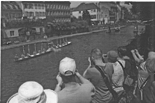
Des joutes suivies avec intérêt depuis les quais.

► Dimanche 17 juillet, entre 10 h et midi, la société nautique 1 887 Strasbourg rencontrera le club de joutes de Zurich, entre le pont Sainte-Madeleine et la passerelle de l'Abreuvoir. Un spectacle à observer depuis les quais.