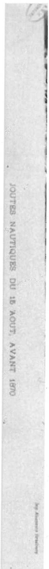
Joutes Nautiques devant le Palais Rohan à Strasbourg

Les joutes nautiques alsaciennes tirent de cette tradition une pratique légèrement différente : quatre rameurs sont assis les uns derrière les autres à cheval un banc central. Chaque rameur est équipé d'un seul aviron. Le barreur est chargé de manœuvrer la barque à l'aide d'un stachelrime , une rame semblable à une pagaie et qui sert d'aviron de gouverne.